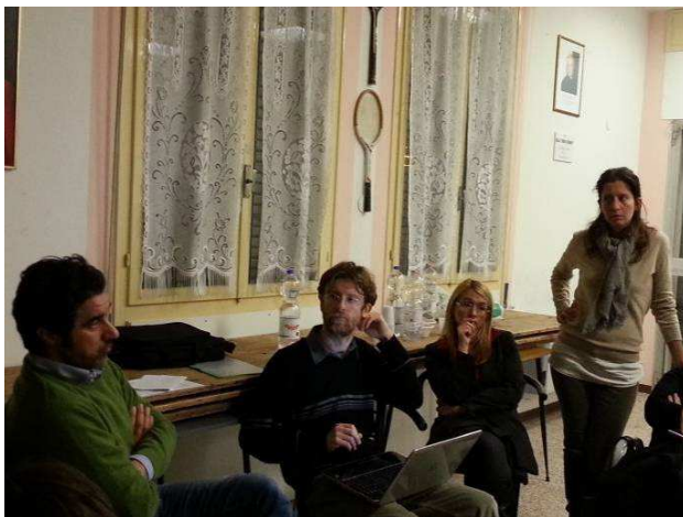
Primo laboratorio, 22 gennaio 2014

Sono stati invitati rappresentanti delle associazioni di diverso tipo (volontariato, culturali, ambientali), reti e organizzazioni di soggetti locali, quartieri, sindacati.