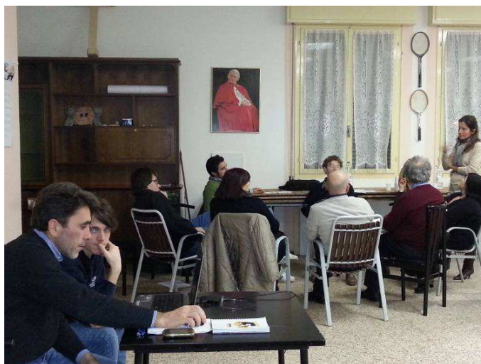
Primo laboratorio, 22 gennaio 2014

A turno è stata data la parola a tutti i proponenti, per illustrare brevemente le proprie proposte agli altri partecipanti, e per ottenere dai medesimi i primi riscontri, opinioni o consigli. Finito il giro di presentazione, si è passati alla esemplificazione di pubblicazione sulla piattaforma di una proposta nuova, a beneficio di coloro che non avevano ancora formulato pubblicamente la propria idea.