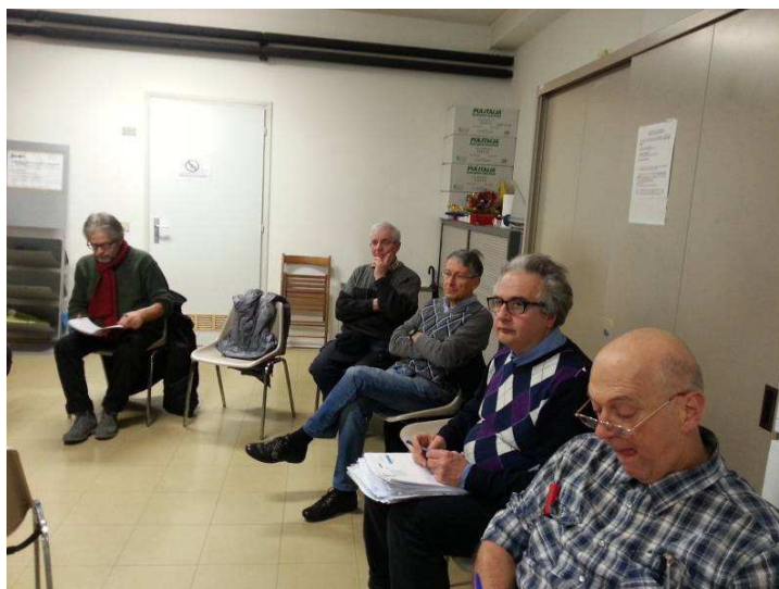
Secondo laboratorio, 29 gennaio 2014

Il dialogo fra i cittadini presenti, che in alcuni casi si conoscevano per la prima volta in quella occasione, è stato portato avanti dai presenti in modo maturo e motivato, con la consapevolezza del dover usare al meglio l'opportunità reale fornita dalla pubblica amministrazione nell'aprire questo processo.