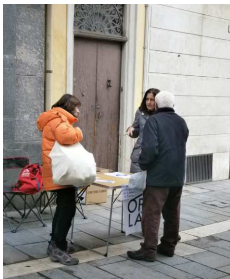
Un banchetto Oplà in Piazza a Faenza