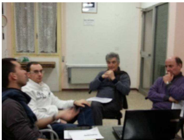
Primo laboratorio, 22 gennaio 2014

Il gruppo di nuovi partecipanti ha approfittato della presenza del facilitatore per raccogliere informazioni relative alle proposte già pubblicate sulla piattaforma, oltre che per vedere insieme la modalità guidata dal sistema per la pubblicazione delle proposte.