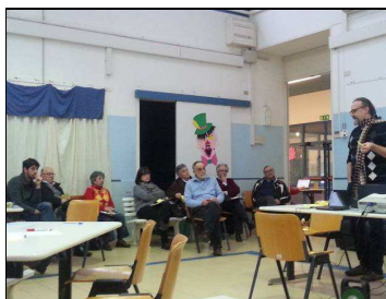
L' Open Space Technology del 18 gennaio 2014