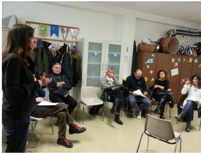
Secondo laboratorio, 29 gennaio 2014