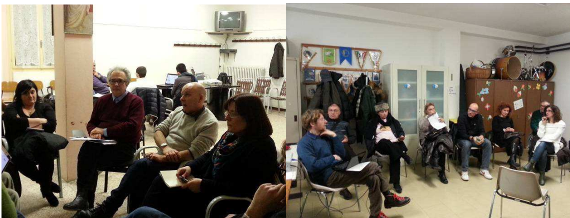
Primo laboratorio, 22 gennaio 2014