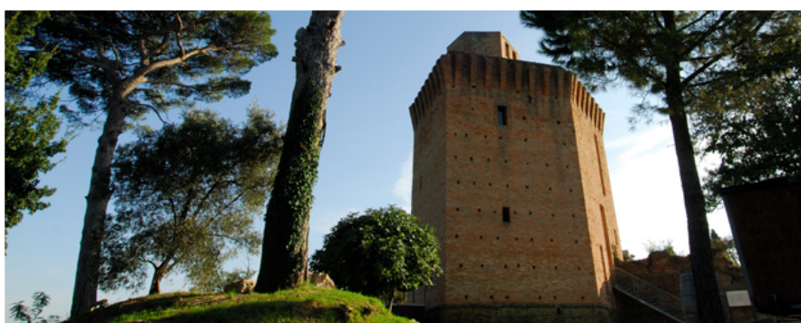
Faenza - Torre di Oriolo dei fichi

La strategia nazionale che impone alla PA l'utilizzo delle tecnologie informatiche costituisce un forte veicolo per diffondere maggiormente la cultura digitale attraverso l'esempio. La sfida colta dalle amministrazioni del territorio Faentino alcuni anni or sono ha permesso di raggiungere un punto di eccellenza per i servizi digitali alle imprese, tale primato lo si vuole mantenere ed estendere ad altri ambiti, primi tra tutti i