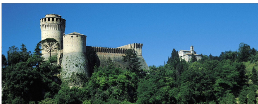
Brisighella - Rocca e Santuario del Monticino

La politica ha posto la strategia digitale al centro del dibattito in tutte le principali economie del mondo, in Italia l'Agenzia per l'Italia Digitale (AgID) ha il compito di garantire la realizzazione degli obiettivi dell'Agenda digitale italiana in coerenza con quelli della DAE, in particolare nell'ambito dell'Accordo di Partenariato 2014-2020 la Presidenza del Consiglio insieme al Ministero dello Sviluppo Economico, all'Agenzia per l'Italia Digitale e all'Agenzia per la Coesione ha predisposto i piani nazionali «Piano nazionale Banda Ultra Larga» e «Crescita Digitale» per il perseguimento degli obiettivi dell'Agenda Digitale istituita il 1° marzo 2012.