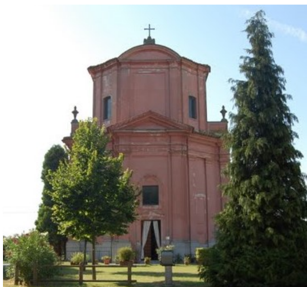
Solarolo - Santuario della Madonna della Salute

Lo sviluppo digitale deve essere partecipato, occorre fare comunità per rendere partecipe il cittadino alla Cosa Pubblica informandolo in maniera conforme con modalità al passo coi tempi, in tale ambito ci si prefigge di adottare, come Unione, strumenti di comunicazione digitale includendo il ricorso ai social media, per favorire la conoscenza dell'istituzione e dei suoi servizi. La comunicazione digitale dovrà essere semplice e comprensibile, meno burocratica e tesa a valorizzare il patrimonio informativo pubblico e l'azione dei Comuni e dell'URF in maniera coordinata attraverso i siti istituzionali e i nuovi media digitali.