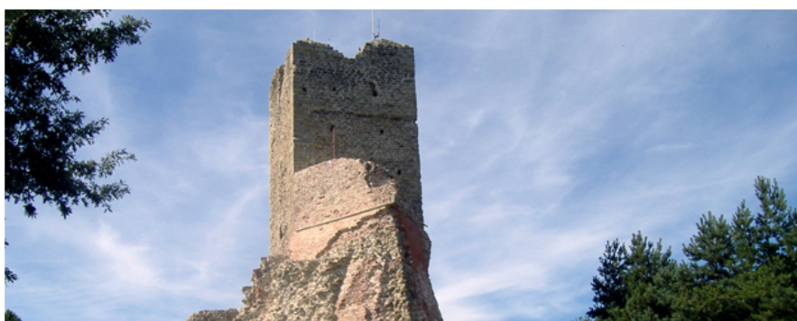
Casola Valsenio - Rocca di Monte Battaglia

L'Unione della Romagna Faentina si è costituita il 30 novembre 2011, a seguito dell'allargamento dell'Unione dei Comuni di Brisighella, Casola Valsenio, Riolo Terme, precedentemente costituita il