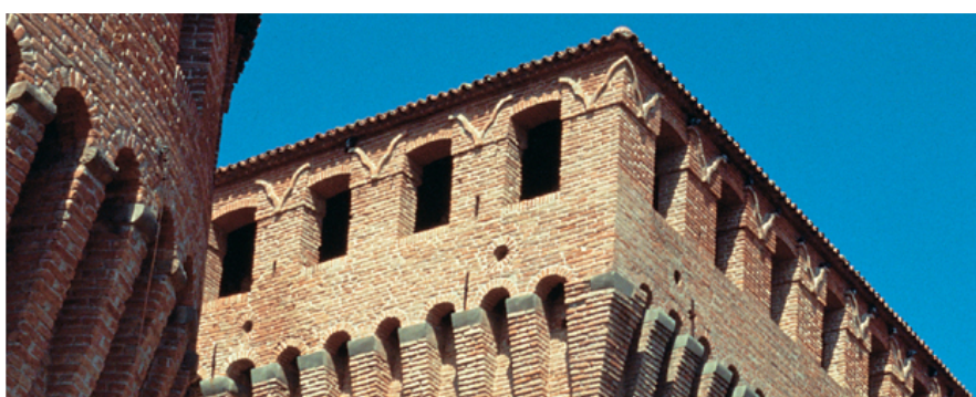
Riolo Terme - Uno scorcio della Rocca

Sulla base di questo principio il Comune di Faenza ha condotto nel passato un percorso finalizzato a fornire dati aperti, cioè informazioni liberamente accessibili a tutti le cui eventuali restrizioni sono l'obbligo di citare la fonte. Tale esperienza verrà estesa all'Unione della Romagna Faentina e agli altri enti ad essa aderenti, con particolare riferimento ai dati finanziari.