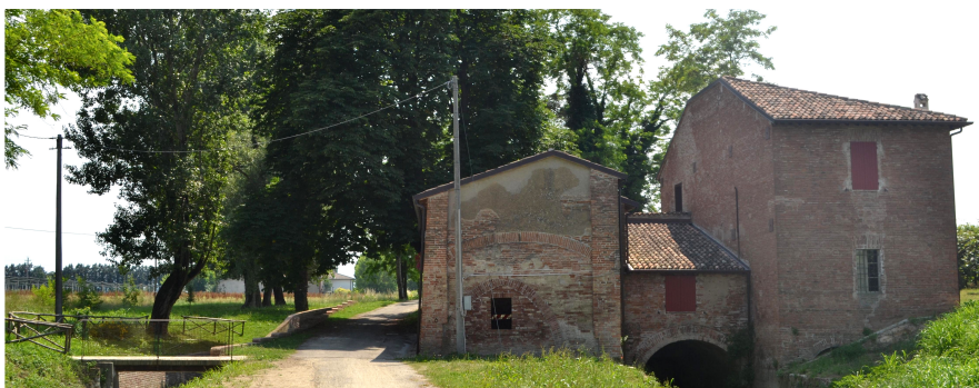
Castel Bolognese - Molino scodellino

"La tecnologia è parte integrante della vita quotidiana di milioni di cittadini. Studenti, lavoratori, professionisti e imprenditori si confrontano costantemente con i rischi e le opportunità determinate dall'innovazione tecnologica. Per i giovani che si costruiscono una prospettiva, per le piccole imprese che devono competere nel mondo, per i cittadini che cercano una migliore qualità della vita, l'opportunità offerta dalla tecnologia è irrinunciabile" (ADER).